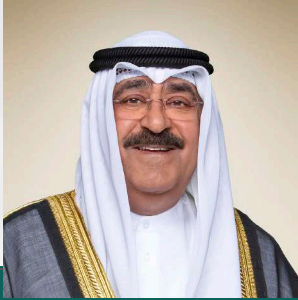
سمو ولي العهد الشيخ مشعل الأحمد الجابر الصباح حفظه الله ورعاه