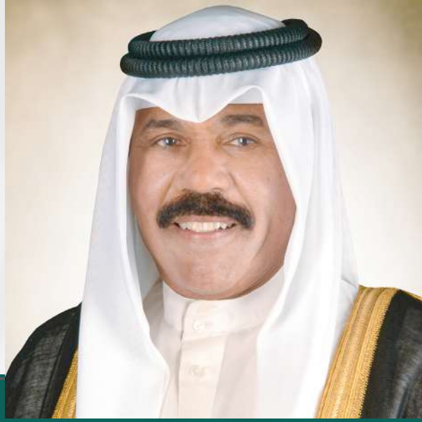
حضرة صاحب السمو أمير البلاد الشيخ نواف أحمد الجابر الصباح حفظه الله ورعاه