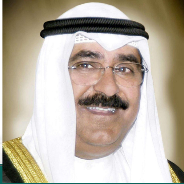
سمو ولي العهد الشيخ مشعل أحمد الجابر الصباح حفظه الله ورعاه