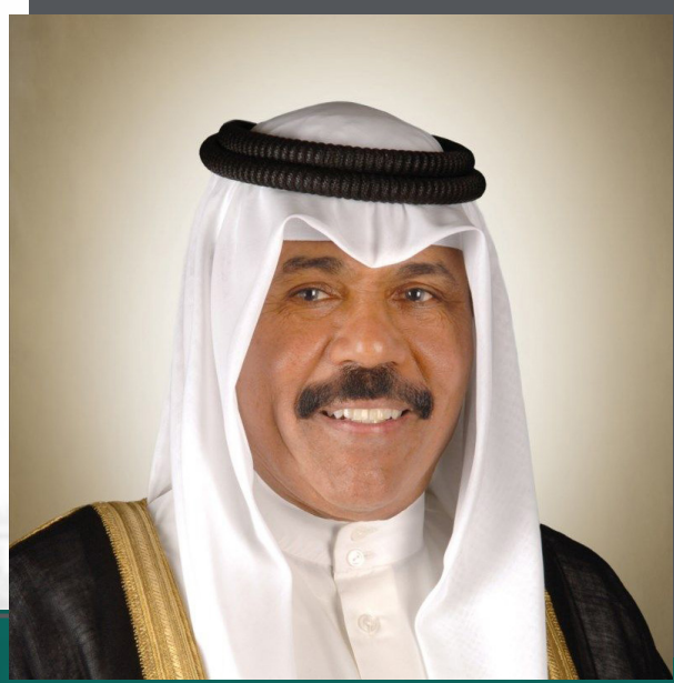
حضرة صاحب السمو أمير البلاد الشيخ نواف أحمد الجابر الصباح حفظه الله ورعاه