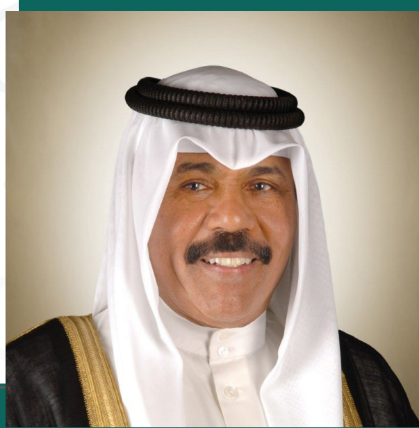
حضرة صاحب السمو أمير البلاد الشيخ نواف الأحمد الجابر الصباح حفظه الله ورعاه