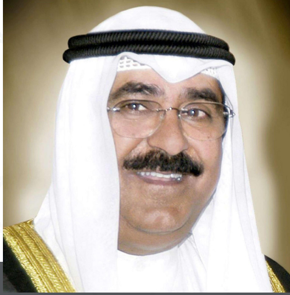
سمو ولي العهد الشيخ مشعل أحمد الجابر الصباح حفظه الله ورعاه