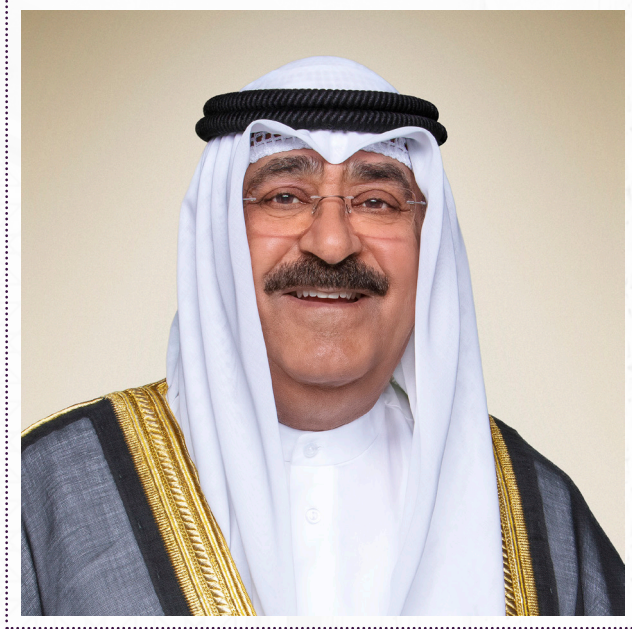
صاحب السمو الشيخ مشعل أحمد الجابر الصباح أمير دولة الكويت حفظه الله